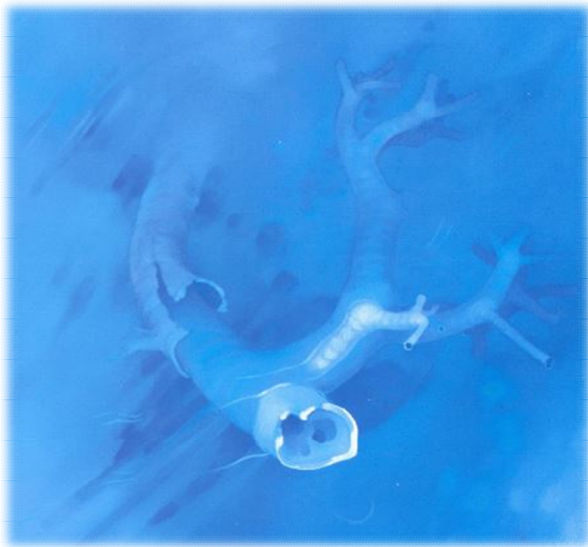
Albero sommerso 1979

Il Collegio Docenti riconosce alle famiglie e agli atleti di alto livello la possibilità di chiedere che una parte delle ore dei PCTO (40 per il tecnico e 55 per il professionale) si realizzi nell'ambito delle attività sportive praticate dagli Studenti-atleti ai massimi livelli agonistici, sulla base di un percorso formativo personalizzato condiviso tra scuola e ente sportivo.