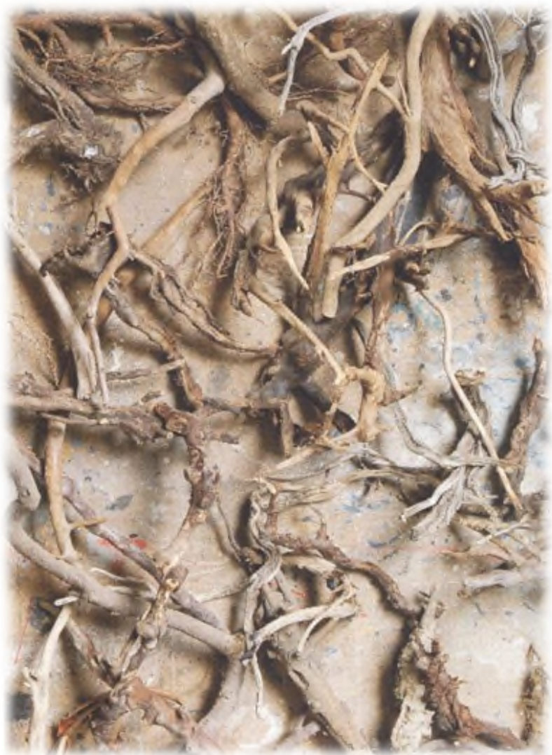
Particolari di radici