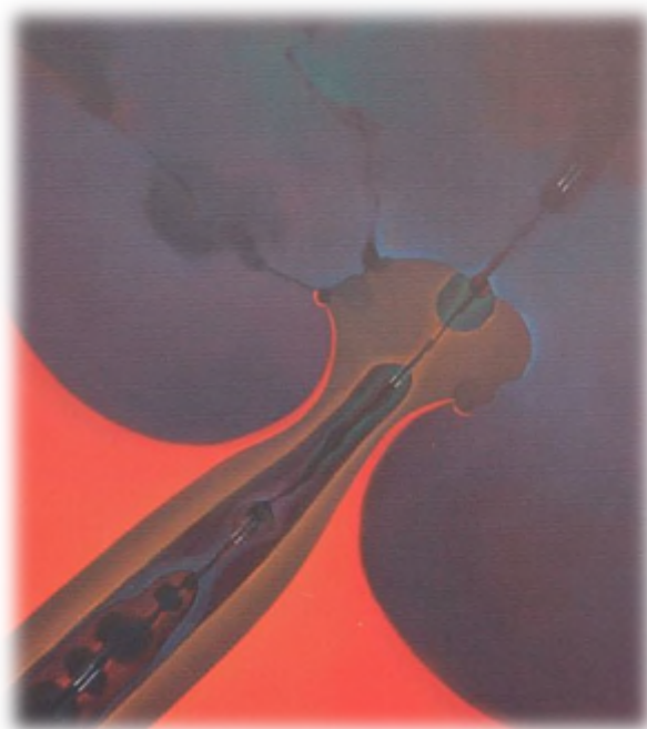
Terra, acqua e fuoco 2002