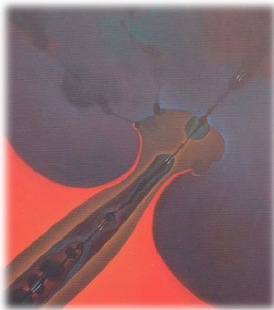
Terra, acqua e fuoco 2002