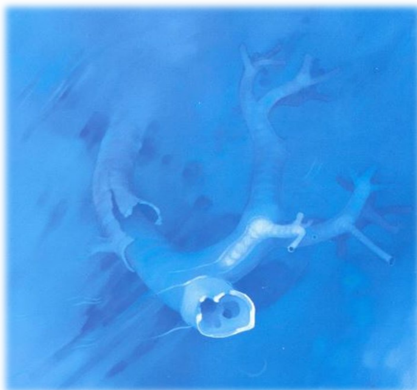
Albero sommerso 1979

Piano Annuale Inclusione ( http://bes.iisrignonistern.eu/piano-annuale-inclusione/ )