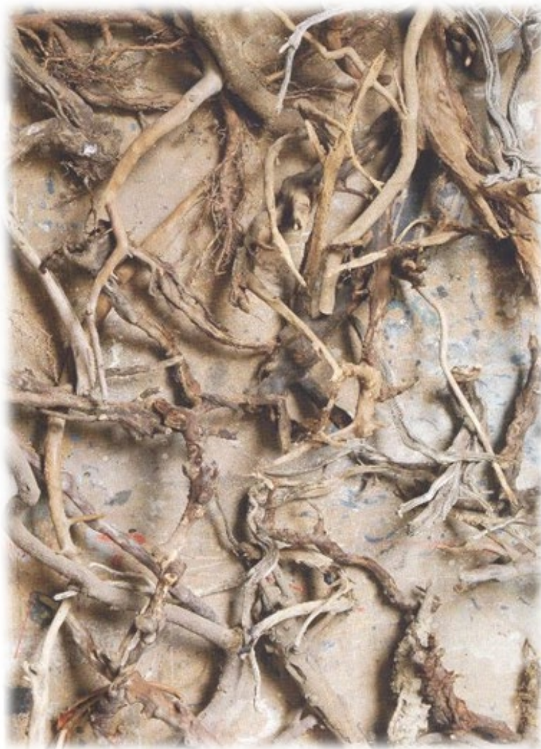
Particolari di radici

Il nostro piano di formazione è già disegnato ed è già stato votato dal Collegio dei docenti nel momento dell'approvazione dei PNRR. I docenti dovranno partecipare alle attività formative previste dal DM. 66/2023 e alle attività formative previste dalla Linea di intervento B del D.M. 65/2023. La partecipazione risulta obbligatoria fino al raggiungimento del monte ore previsto Art. 44 comma 4 del Contratto – Attività funzionali all'insegnamento.